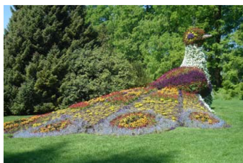
barvito cvetje na otoku Mainau